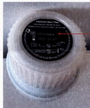
Etikett des Sensorapplikators

Wir haben die Swissmedic (Schweizerisches Heilmittelinstitut) informiert.